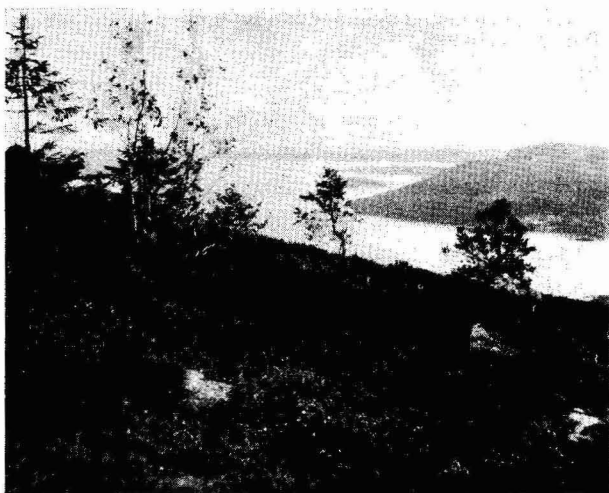
Från Skulebergets topp.