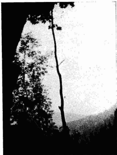
Från ingången till grottan i Skuleberget.