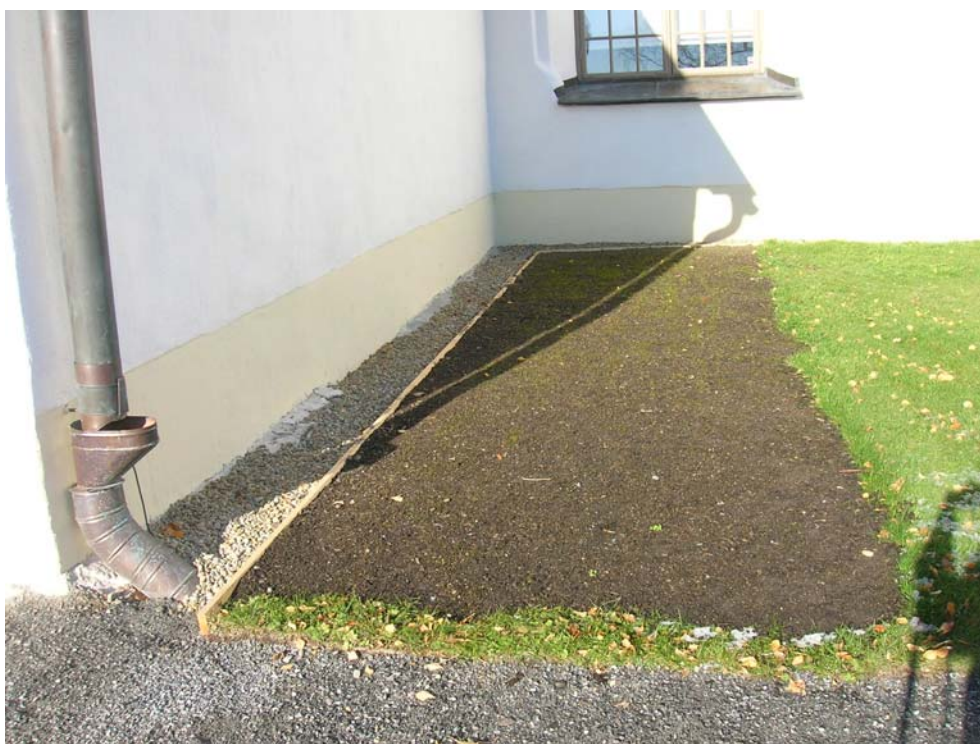
Efter isolering av grundmur mot öster. 2007-10-12.