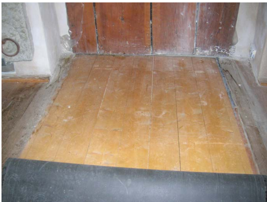
2007 06 23. Golv vid vapenhusets entré.

På plats ser man att golvet har fästs med spik uppifrån, som pluggats igen (ej spontat). Ca 1 kvm framför entrén har avvikande nyare bräder under mattan. Där har golvet tagits upp omigen eller också har man kompletterat med nyare bräder vid förra restaureringen.