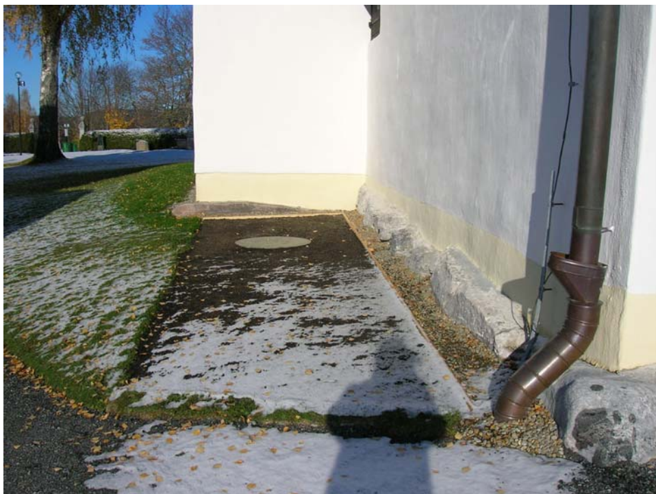
Efter isolering av grundmur mot väster. 2007-10-12.