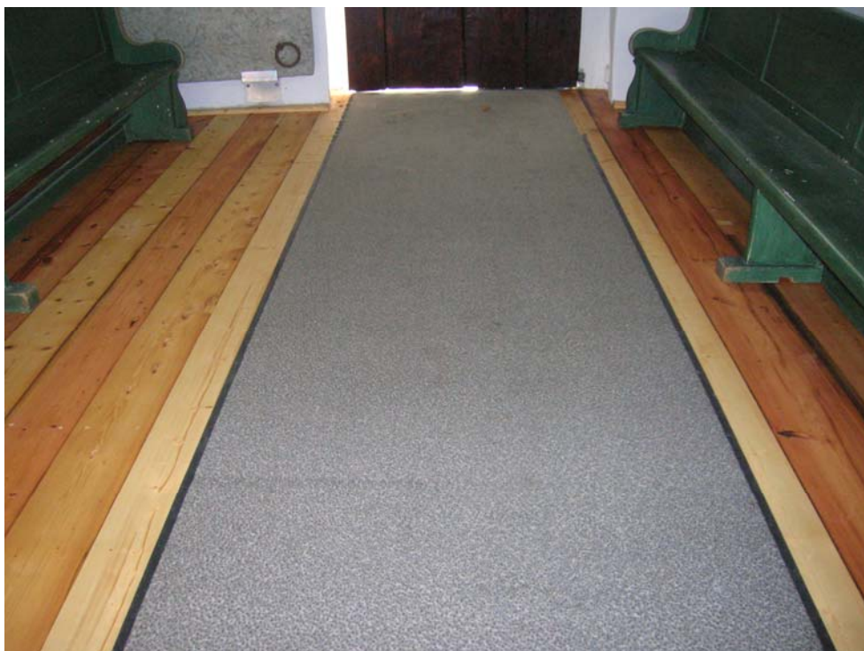
Golvet lades tillbaka och pluggades (nedan) på samma sätt som tidigare.