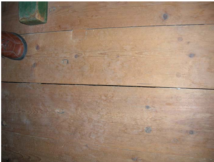
2007 06 23 före upptagning av golvet utmed östra väggen.