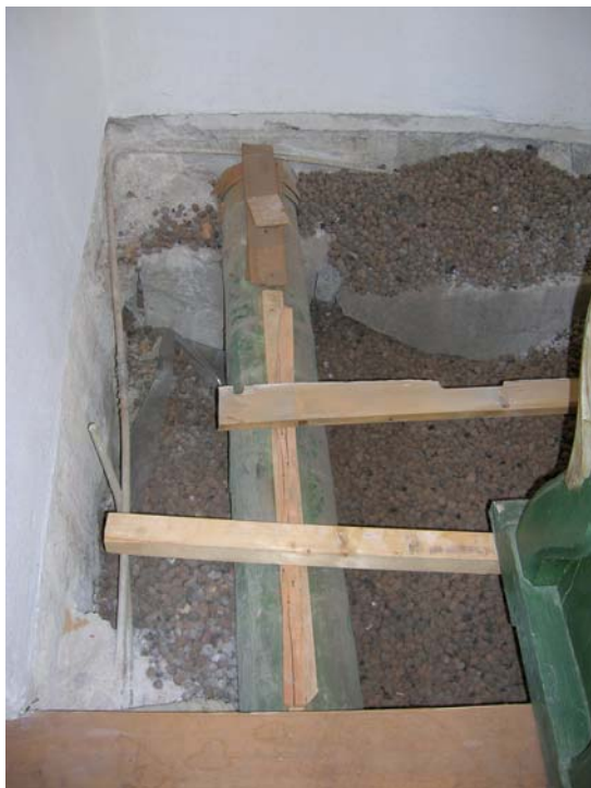
Isolering utmed vägg mot långhuset. 2007-09-11.