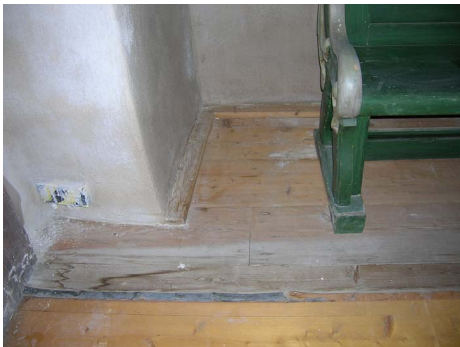
2007 06 23. Golv vid entrén till långhuset före demontering.