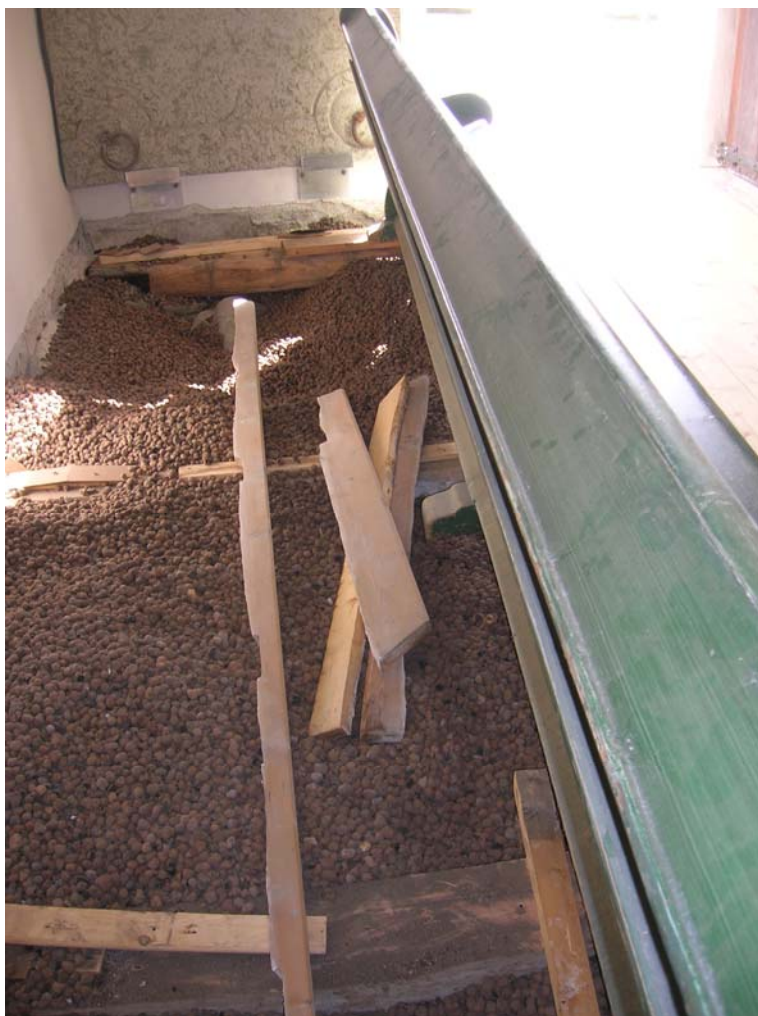
Befintlig isolering av leca utmed östra väggen. 2007-09-11.

När man hade tagit upp ett ca 1,5 meter brett fält av golvytan utmed vapenhusets insida av östra muren kunde man konstatera att hela grunden är fylld med lecakulor till ett djup av över en halvmeter. Eftersom 40 cm leca motsvarar 8 cm cellplast, som planerades läggas dit enligt programmet, avstod man från den tänkta isoleringen invändigt. Grunden var helt helt torr vid undersökning. Golvbräderna var uppmärkta och kunde återanvändas.