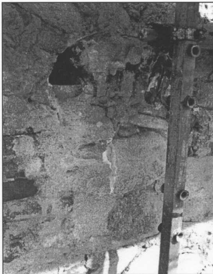
En valvslagen dörr eller fönster återfanns i murverket.

HEKAB Elkonsult har genom Arne Gunnvard har genomfört en ombyggnad av följande eltekniska apparatur: utbyte av huvudledning, ändring av bakre utrymme under läktare, ljusreglering av 3 stycken takkronor inklusive utbyte av ledning, hissordning av 3 stycken ljuskronor samt anpassning av befintlig ljudanläggning och ändring av befintlig klockstyrning med tryckknappslådor.