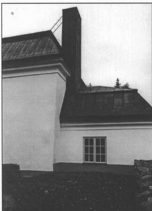
Sakristian på kyrkans norra sida och värmeanläggningens skorsten.