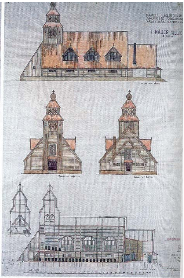
Uppslag ur Träkyrkor i Sverige, 1999.