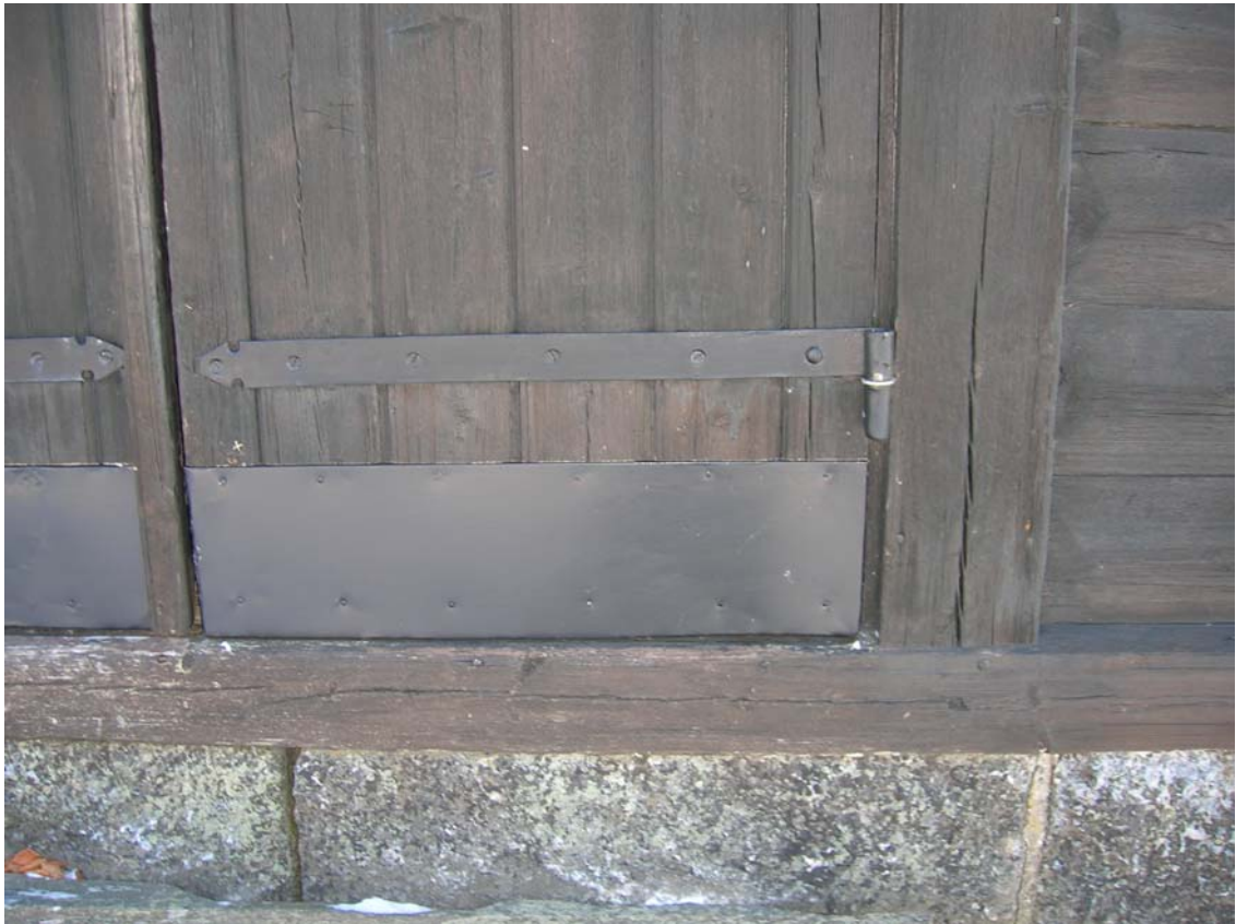
2007-10-12. Igensatt äldre dubbelport mot söder, detaljbild av panel och foder.