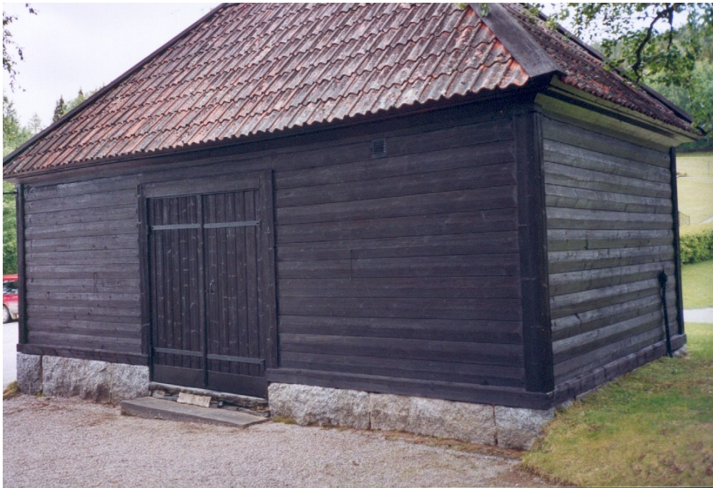
Kistboden före ombyggnaden.

Den enväniga kistboden med rektangulär plan har sannolikt regelstomme klädd med liggande brunsvart stockpanel. Kistboden är byggd i överensstämmelse med kyrkans nationalromantiska stil och inger ett robust och kompakt intryck. Det lilla huset står på en sockel av tuktad granit och det valmade taket är täckt med enkupigt tegel. Det finns ett fönster mot norr och två panelklädda dubbelportar med långa smidda bandgångjärn på två fasader, varav den ena leder direkt in till andaktsrummet, som utgör nästan hela byggnadens rymd. I rummet finns inga möbler men ett enkelt altare under fönstret. Väggarna är klädda med omålad stående träpanel. På 1980-talet gjordes en ombyggnad för installation av kylcell för två kistor i redskapsboden i husets västra del.