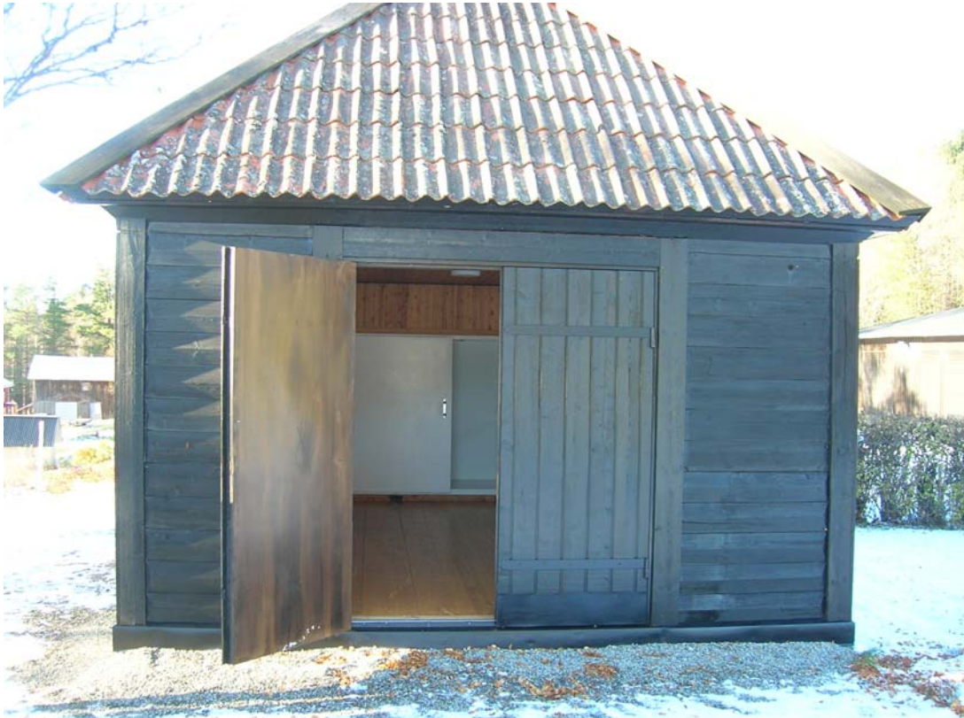
2007-10-12. Nyttillverkad dubbelport med marmorerad insida före ommålning.