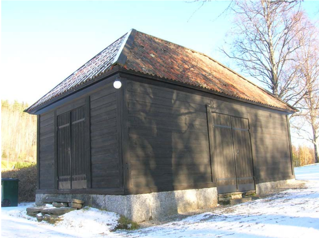
Äldre dubbelportar mot väster och söder 2008-03-19.