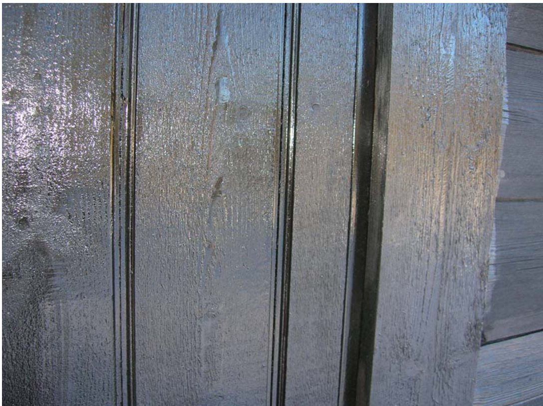
2007-10-12. Nyttillverkad dörr mot öster, detalj av dörrblad och foder.