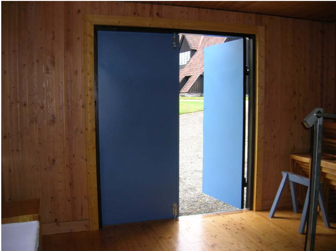
2008-09-19. Den nya dubbelporten färdigmålad.